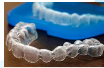
ホワイトニング マウスピース